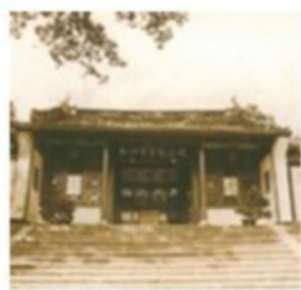
八十年代的南湖革命纪念馆