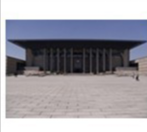
嘉兴南湖革命纪念馆新馆