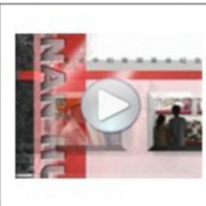
南湖革命纪念馆-展厅