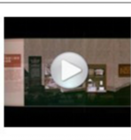
前进中的南湖革命纪念馆