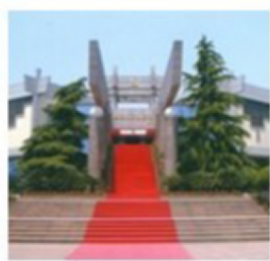
嘉兴人民捐资建设...