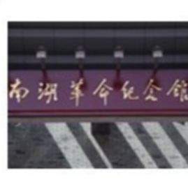
南湖革命纪念馆新馆牌匾